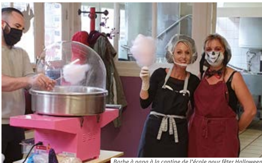
Barbe à papa à la cantine de l'école pour fêter Halloween.

Le vendredi des vacances de la Toussaint, les élèves demi-pensionnaires de l'école primaire de Saint-Mards-en-Othe ont eu la bonne surprise d'avoir un dessert inattendu : Elite, le fournisseur des repas de l'école, avait apporté une machine à barbe à papa. Dans la cantine décorée pour l'occasion sur le thème d'Halloween, les élèves déguisés majoritairement de façon effrayante ont dégusté leur barbe à papa à l'issue d'un repas marqué par la curiosité et l'excitation de cet événement. D'autres animations sont prévues durant l'année scolaire : une fondue au chocolat, d'abord, puis en fin d'année de la glace qui sera confectionnée sur place avec les enfants. ■