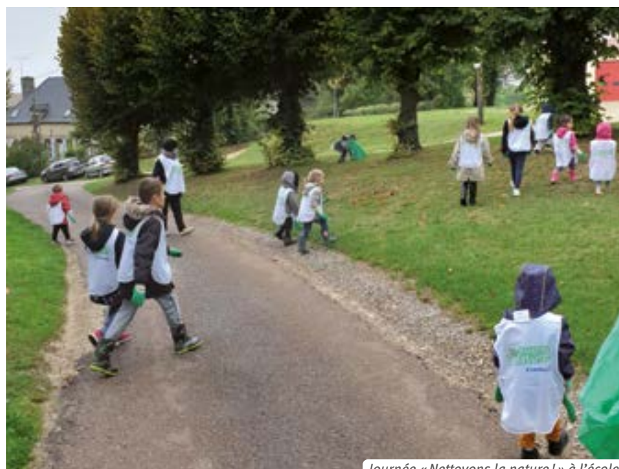
Journée « Nettoyons la nature ! » à l'école.