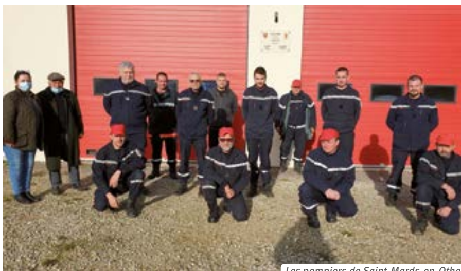
Les pompiers de Saint-Mards-en-Othe.