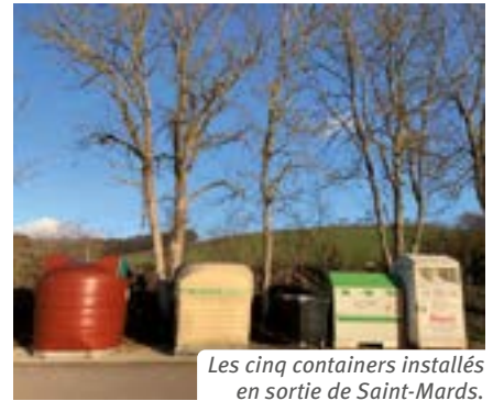
Les cinq containers installés en sortie de Saint-Mards.

Au même endroit nous avons placé un cinquième container destiné exclusivement aux habitants des résidences secondaires qui pourront ainsi déposer leurs poubelles avant de regagner leurs habitations principales. Nous comptons sur vous pour laisser ce container à l'usage des résidents occasionnels. Pour les résidents permanents, le ramassage des poubelles ordinaires reste inchangé : très tôt tous les jeudis matin.